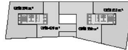
5.KAT PLANI - BÖLÜNEBİLİR YERLEŞİM